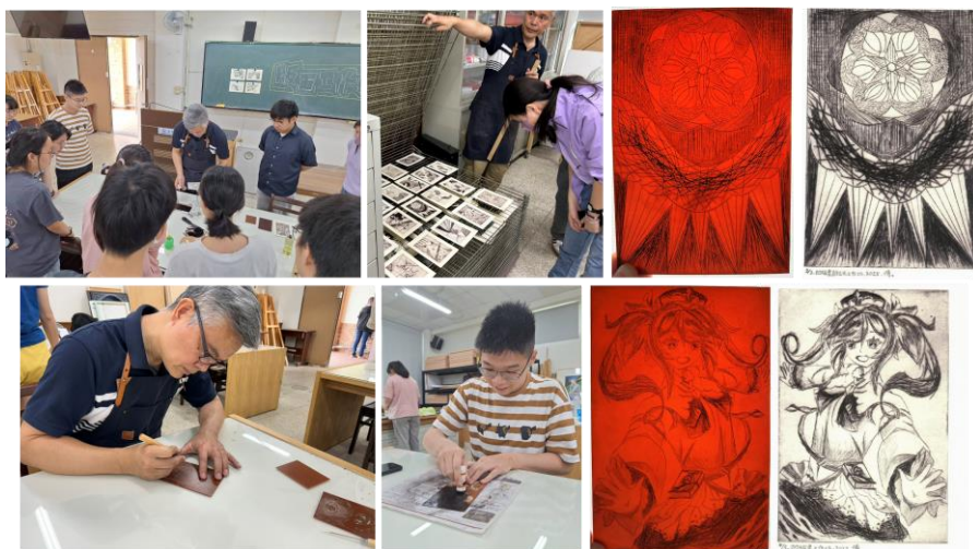
圖二 113-2 凹版畫-直刻法工作坊 微學分一課程紀錄與作品成果

這次工作坊不僅讓我掌握直刻法的核心技巧，更啟發我對傳統藝術當代價值的思考。在數位時代，手工創作特有的質感與不可複製性反而成為最珍貴的藝術特質。未來我計劃進一步探索蝕刻等其他凹版技法，持續擴展我的版畫創作視野。